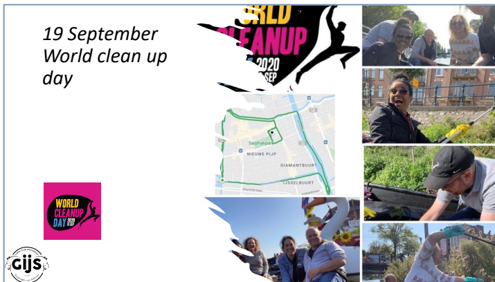
Fotocollage van de acties 2020-2021: