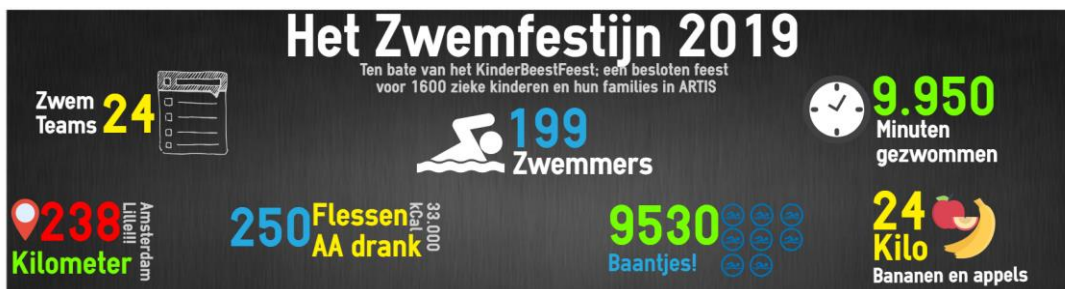
Infographic Zwemfestijn, april 2019