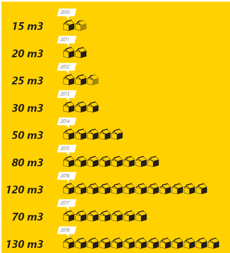
Infographic Sintinzamelingsactie, december 2018